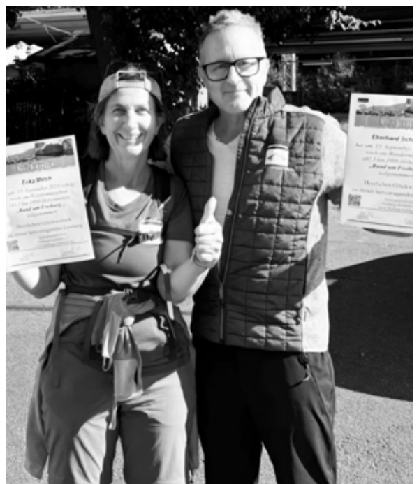
Die beiden stolzen und glücklichen Teilnehmer mit ihren Urkunde