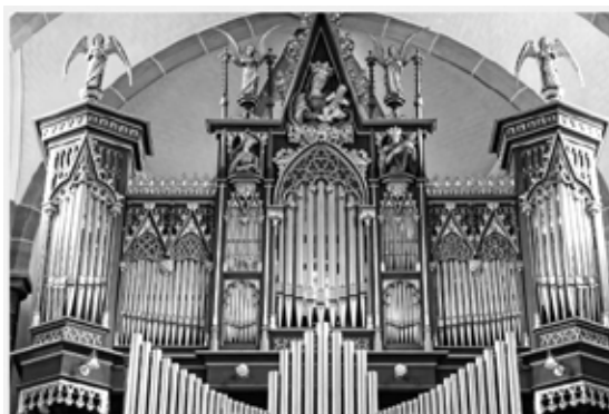
Orgel Schönau