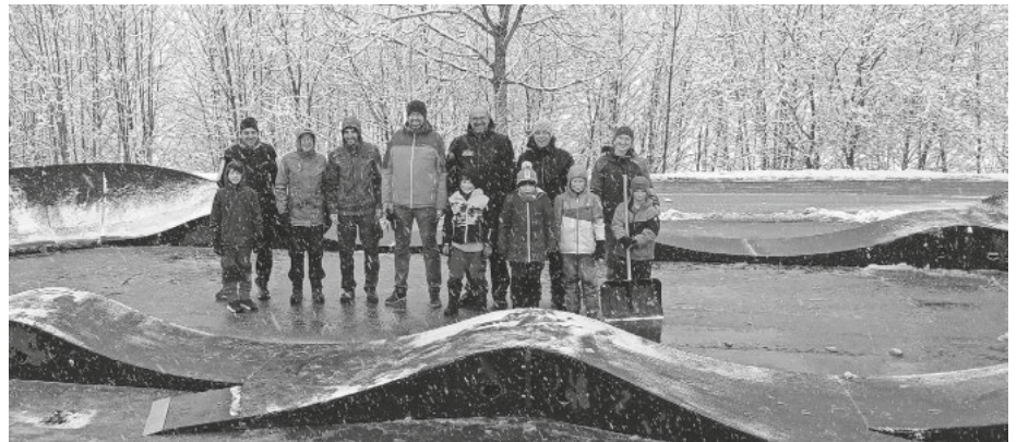
Der Pumptrack befindet sich bis zu den Herbstferien am Parkplatz des Scheuermattkopfliftes in Todtnauberg, Schwimmbadstraße. Nach den Herbstferien wird wieder abgebaut.

das Mountainbiketraining wieder am Montag, den 13.04. ab 17:00 Uhr am Radschert in Todtnauberg los. Keine Angst vor Matsch! Wir freuen uns auf Euch. Das Bike Team des Skiclub Todtnauberg.