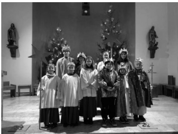
Sternsingergruppe Geschwend/Präg

Ein besonderer Dank geht an das Gasthaus Rößle und an die 2 Präger Mütter für die Bewirtung, sowie an das Vorbereitungsteam.